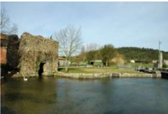
Castellum de Alcabideque