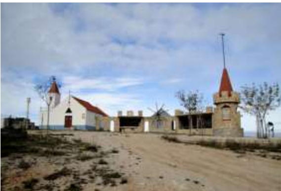
Capela de Santo António

Canhão do vale dos Poios: 39°58'57.76"N 8°33'19.18"W