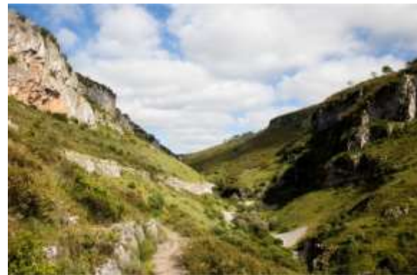
Canhão do vale dos Poios